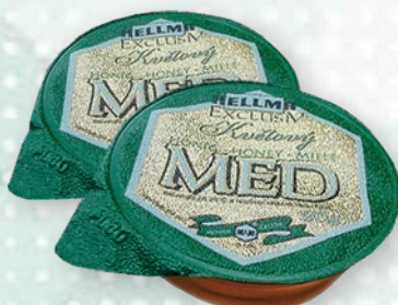
■ Med květový EXCLUSIV Obsah balení: 120ks × 20g