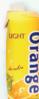
■ Drink pomeranč Obsah balení: 18ks × 250ml bez přidaného cukru