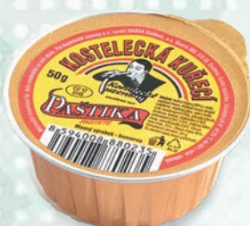
■ Kuřecí paštika Obsah balení: 36ks × 50g