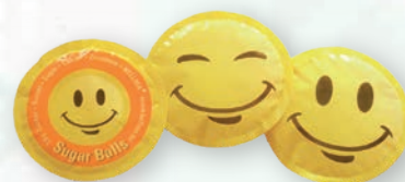
■ Cukr bílý SUGAR BALLS Obsah balení: 400ks × 3,6g