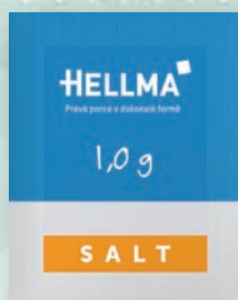
■ Sůl porce Obsah balení: 2000ks × 1g