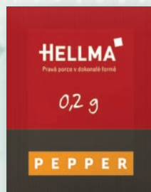
■ Pepř porce Obsah balení: 2000ks × 0,2g