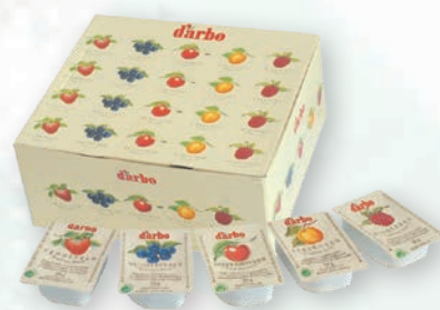
■ Džem Darbo MIX Obsah balení: 5 × 20ks × 25g