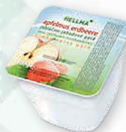
■ Jablečná přesnídávka-jahoda Obsah balení: 48ks × 100g