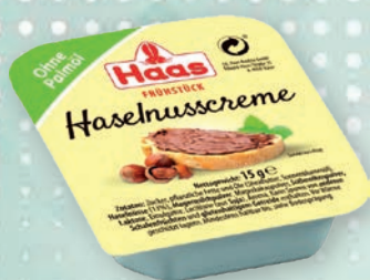
■ Oříškočokoládový krém HAAS Obsah balení: 112ks × 15g