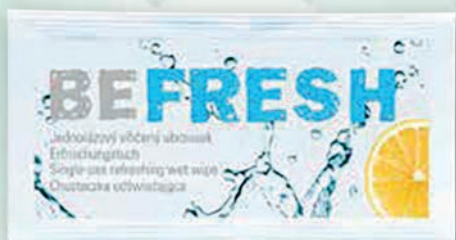
■ Osvěžující ubrousek BE FRESH nebo jiné hygienicky balené antibakteriální ubrousky Obsah balení: 400ks