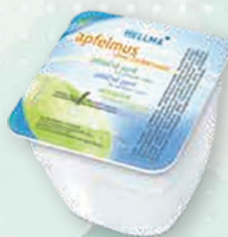
■ Jablečná přesnídávka Obsah balení: 48ks × 100g bez přidaného cukru