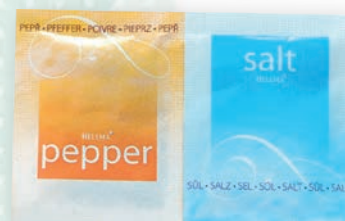
■ „Dvojče“ sůl a pepř Obsah balení: 1000ks