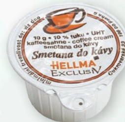
■ Smetana do kávy EXCLUSIV Obsah balení: 120ks × 10 ml