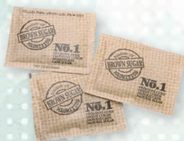
■ Cukr třtinový Obsah balení: 200ks × 4g