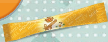
■ Med květový LANGNESE Obsah balení: 80ks × 8g