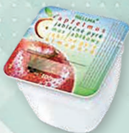
■ Jablečná přesnídávka Obsah balení: 48ks × 100g