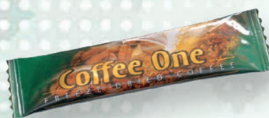
■ Coffee One FREEZE DRIED Obsah balení: 3 × 50ks × 2g