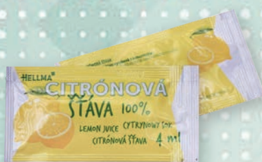
■ Citronová šťáva Obsah balení: 100ks × 4 ml